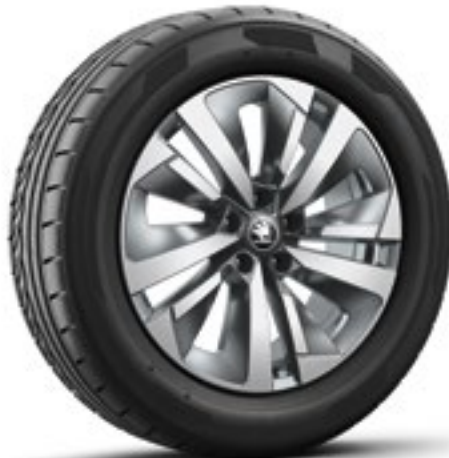
18 tum Soira Aero lättmetallfälgar i antracit