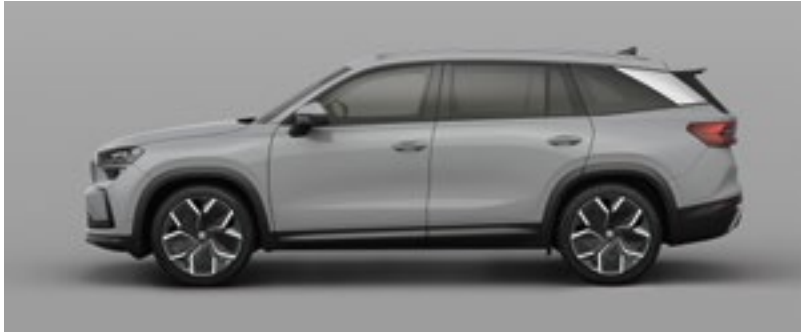
Steel Grey, Unilack