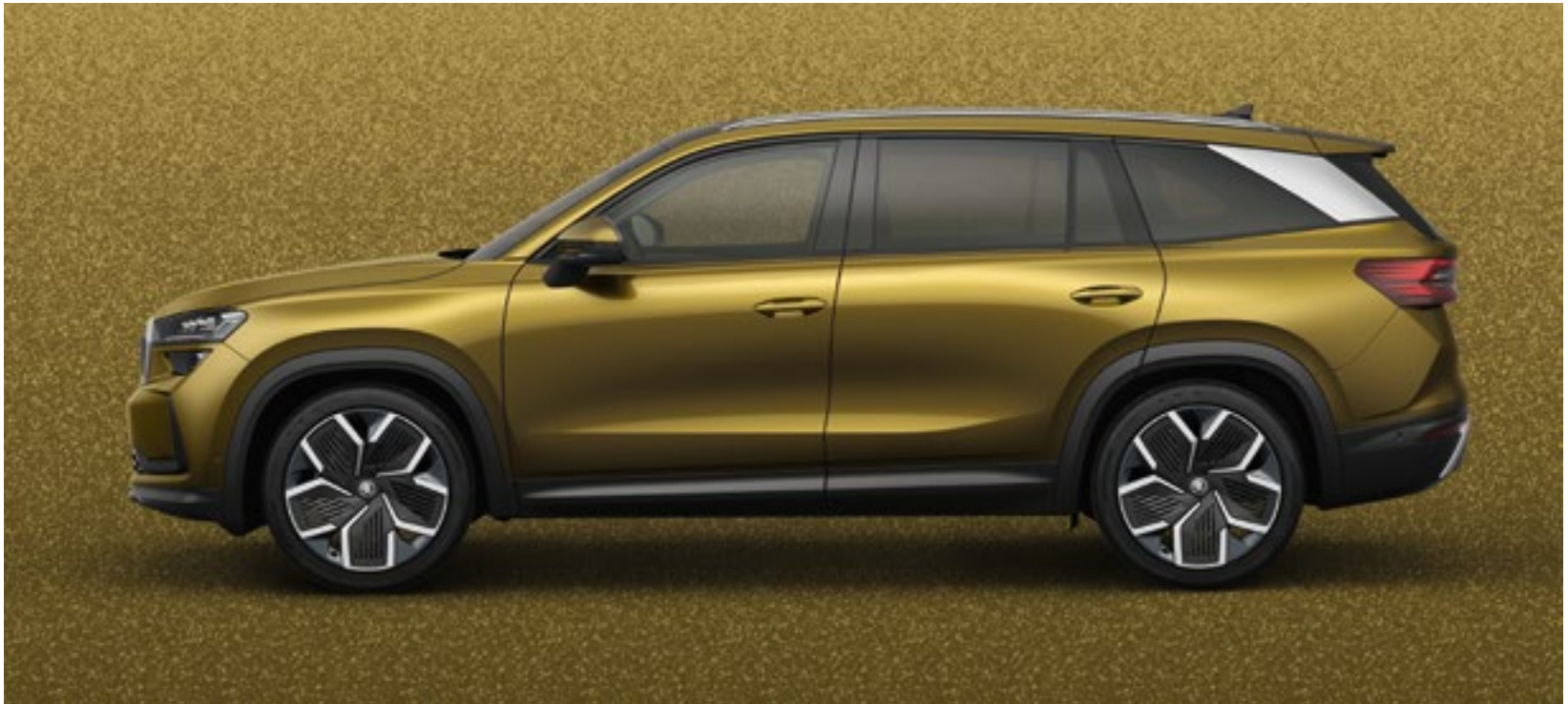
Bronx Gold, metallic