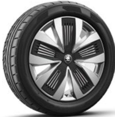
19 tum Talgar Aero lättmetallfälgar i silver med svarta Aero-hjulsidor