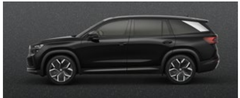
Magic Black, metallic