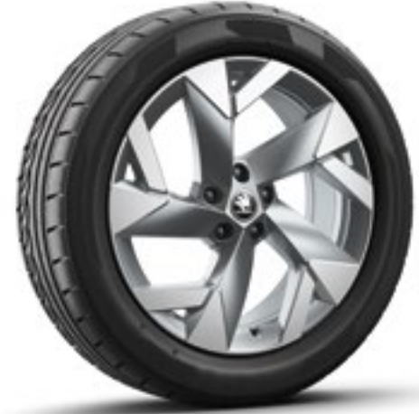
19 tum Tirsuli Aero lättmetallfälgar i antracit*