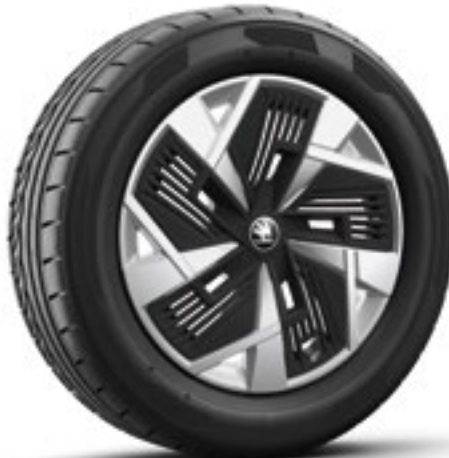
18 tum Mazeno Aero lättmetallfälgar i silver med svarta Aero-hjulsidor