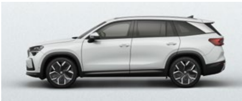
Moon White, metallic