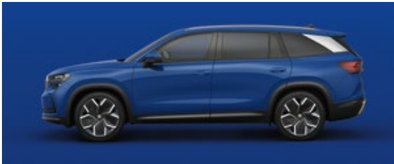
Energy Blue, Unilack