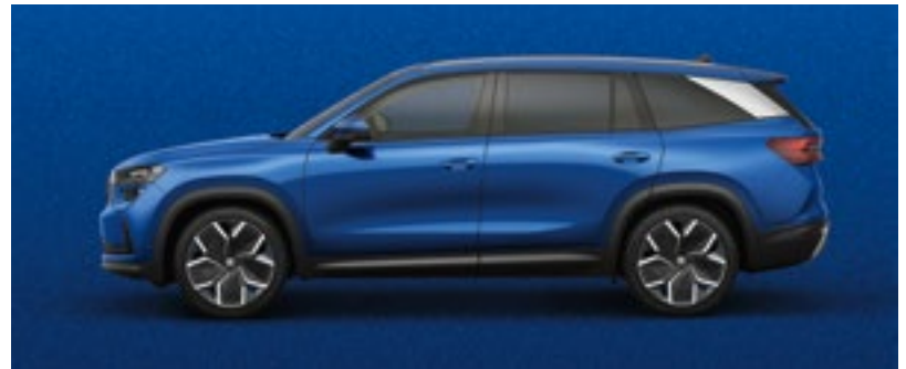
Race Blue, metallic