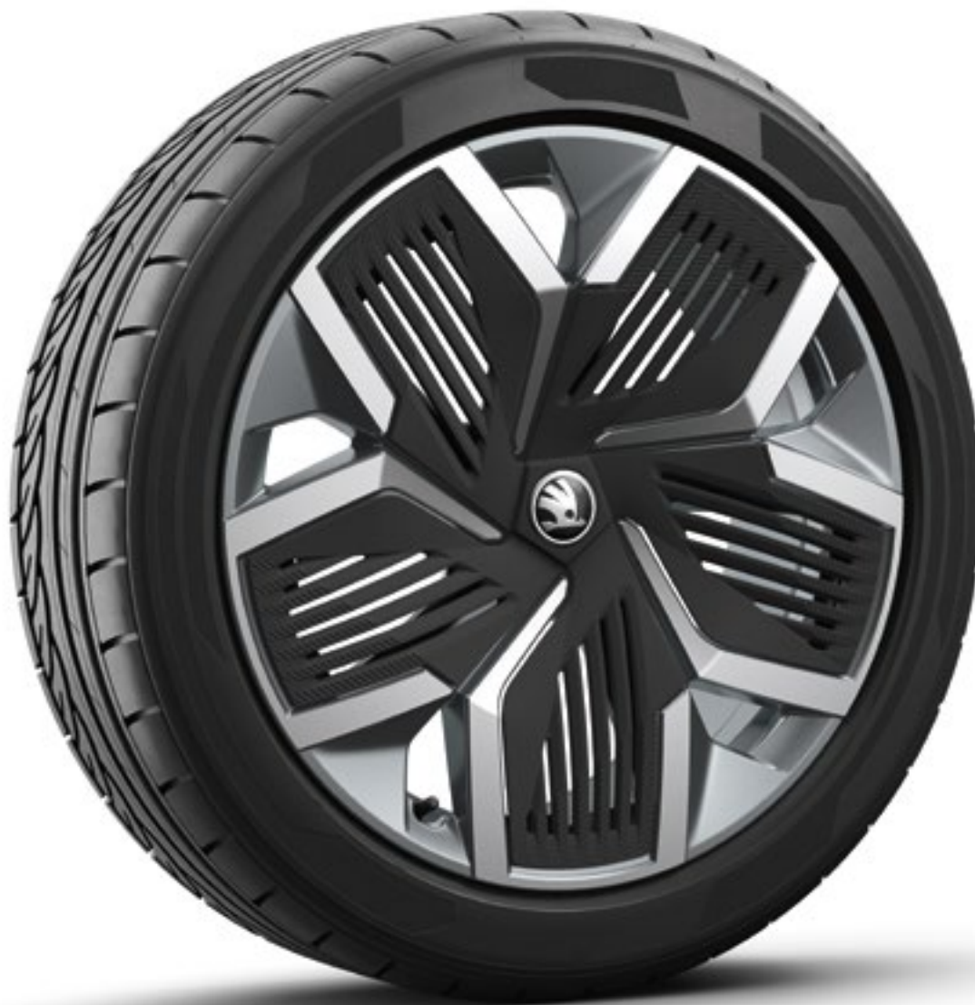
20 tum Rila Aero lättmetallfälgar i antracit med svarta Aero-hjulsidor