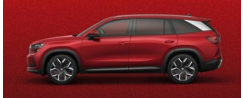
Velvet Red, metallic