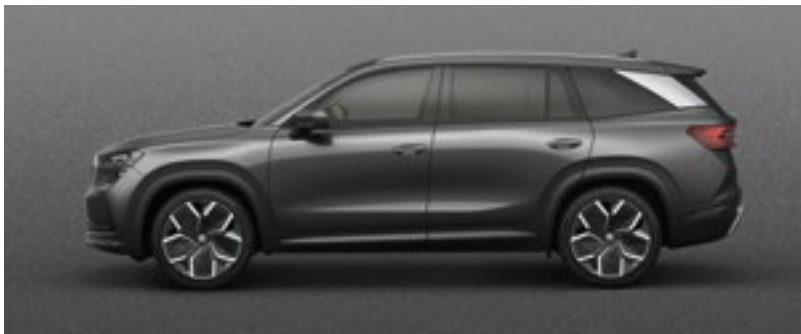
Graphite Grey, metallic