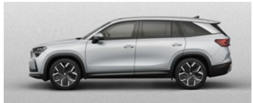
Brilliant Silver, metallic