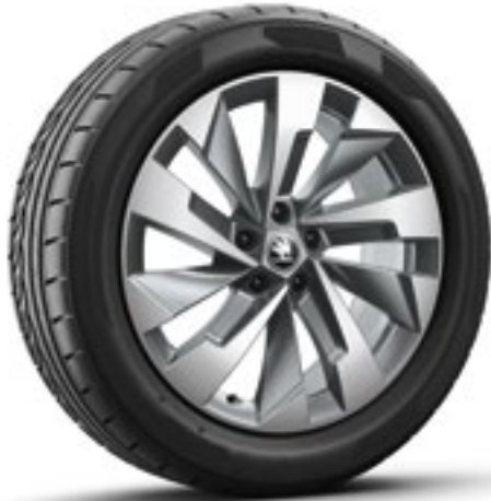
19 tum Halti Aero lättmetallfälgar i antracit