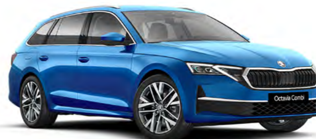
Nya Octavia Combi