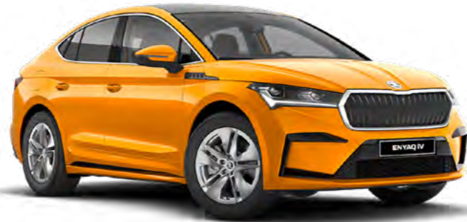
Enyaq Coupe iV